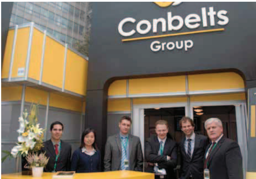
Conbelts企业有意与中国矿业合作